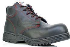
ZAPATO DE SEGURIDAD DIELECTRICO DE PIEL $289.50