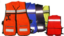
CHALECO BRIGADISTA MÁS DE 18 COLORES $150.00