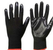
PAR DE GUANTES NYLON CON PU $12.90